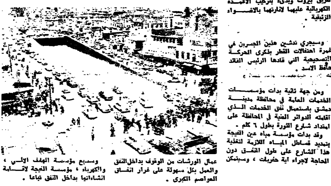
عمال المورشات من الوقت يدخلون العمل بكامل سهولة على غرار انفاق الحوامس الكبرى.

تم انجاز الجسر المعلق الذي اكتملت محافظة دمشق دمشق على امداد شارع الثورة وشارع التحرير فوق جسر كتوريا بحيث يصلان شارع بغداد وشارع الثورة بشارع القنولي على طريق هامة وبني بركبي الاضواء الكروية عليها لانها بالاصواء الزرقية.